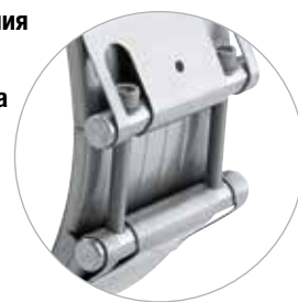
Соединитель NORMACONNECT® FLEX 3 имеет увеличенную ширину ленты 211 мм